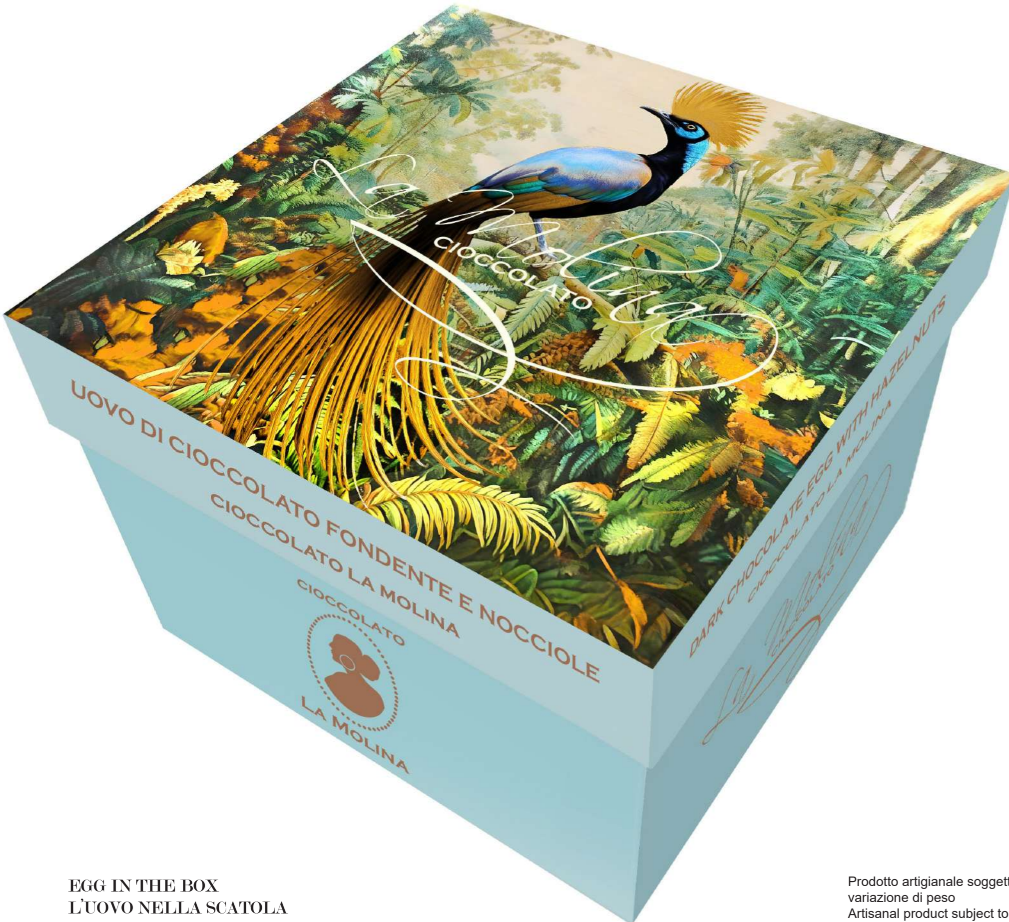
EGG IN THE BOX L'UOVO NELLA SCATOLA